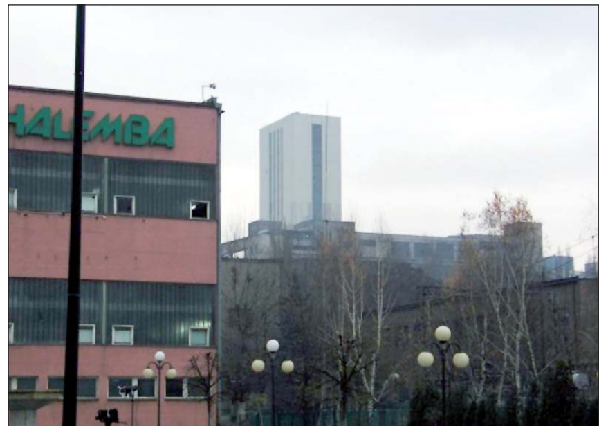
Z powodu sfałszowania danych o wydobyciu w kop. Halemba-Wirek Kompania straci 18 mln zł

Na razie nie wiadomo, kto dopuścił się fałszerstwa. Władze KW poinformowały jedynie, że według ich