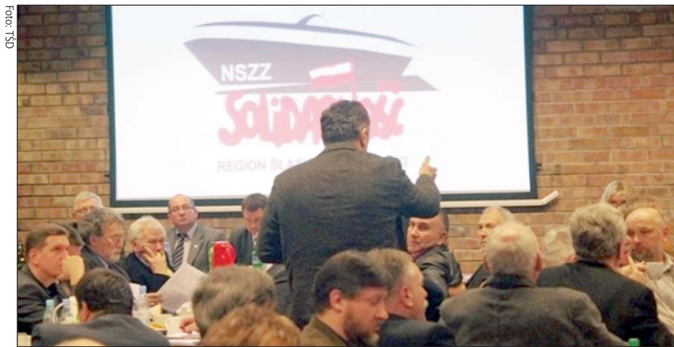
W Katowicach odbyło się pierwsze w tym roku wyjazdowe posiedzenie KK. Kolejne za miesiąc w Łodzi

W osobnym stanowisku członkowie KK zaapelowali do rządu o podjęcie zdecydowanych działań, zmierzających do poprawy warunków funkcjonowania kolejnictwa