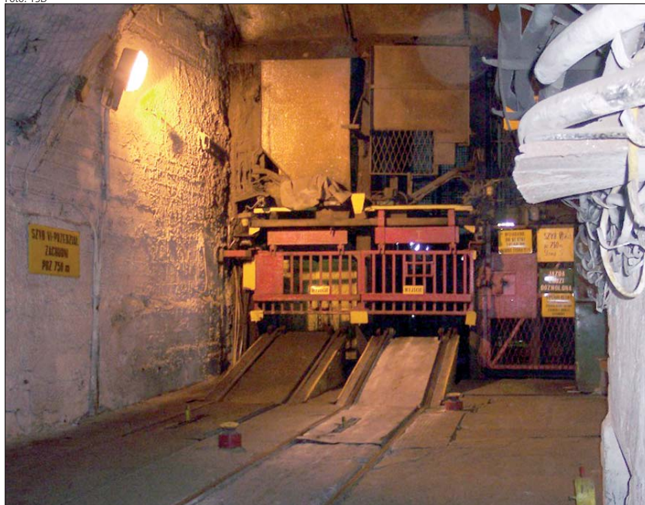
Braki kadrowe w Kompanii Węglowej będą miały wpływ na pogorszenie stanu bezpieczeństwa pracy

formacji na temat jej treści, przekazanych nam przez kierownictwo firmy. Jeszcze w ub. roku w kopalni Halemba powołany został