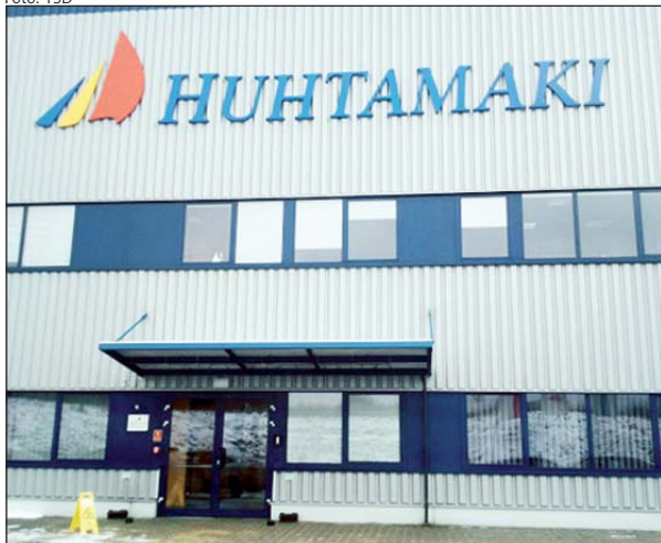
Podwyżki wynagrodzeń zasadniczych w Huhtamaki Food Service mają wynosić nie mniej niż 180 zł brutto

jednorazowych opakowań papierowych, których odbiorcami są m.in. KFC i McDonald. Firma zatrudnia 330 pracowników. Dotychczas średnia płaca produkcyjna w firmie wynosiła ok. 3250 zł brutto.