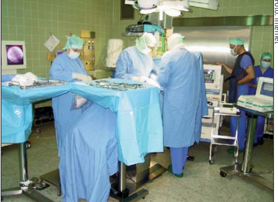
O bezprawnej decyzji pracodawcy Solidarność poinformowała Ministerstwo Zdrowia, samorząd pielęgniarski i Urząd Miasta

– Takie działania naruszają ustawę o zakładach opieki zdrowotnej w zakresie obsadzania kierowniczych stanowisk pielęgniarskich. Jej zapisy nakładają na kie-